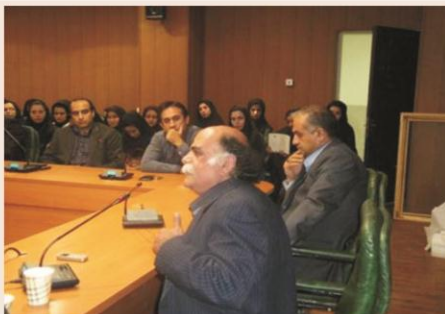
همایش ها و جلسات را لازمه پاسداری از فرهنگ و ادب فارسی عنوان کرد و گفت: شاهنامه، یکی از گهرسارین نمونه‌های شعر و ادب پارسی است که اگر امروز می

تأییم به زبان فارسی باهم سخن گویم مهربان تلاش فردوسی شاعر بزرگ پارسی گوی بوده است. وی افزود: زبان فارسی با ادبیات بزرگ حماسی ایران یعنی اثر جلدانه فردوسی به نام شاهنامه اعتبار می گیرد و اسماجم می یابد و خوشبختانه در زمانه کنونی نیز زبان فارسی پاسداری شده و از وارد شدن فرهنگ و ادب بیگانه به آن محافظت می گردد. استاد کزازی بیان کرد: متأسفانه با گذشت علم و فناوری این نیم می رود که زبان فارسی با هجوم فرهنگ های بیگانه مورد تعرض قرار گیرد و دلسوزان این عرصه باید با وزارتسری زبان فارسی در مقابل واژه های بیگانه در حفظ زبان فارسی بکوشند و نگذارند که ترک شود. وی خاطر نشان کرد: خوشبختانه در استان ایلام ارزش و اعتبار زبان فارسی و شاهنامه فرهنگ و ادب بالایی از اهمیت قرار دارد که حاکی از علاقه مردم فهیم و ادب دوست این دیار به زبان فارسی و ادبیات کهن آن است. در ادامه نیز این استاد برجسته زبان فارسی به بیان متن ها و اشعار از شاهنامه فردوسی برای حاضرین پرداخت.