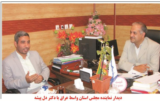
دیدار نماینده مجلس استان واسط عراق با دکتر دل پیشه