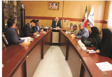
برگزاری جلسه کمیته بهداشت و درمان شورای مبارزه با مواد مخدر در دانشگاه