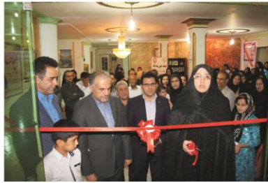
مراسم افتتاحیه نمایشگاه ترویج زراعت طبیعی با حضور مسئولان استانی در ایلام