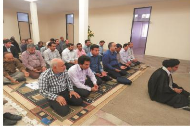
اقامه نماز ظهر و عصر با حضور امام جمعه شهرستان دهلران در ماه مبارک رمضان در شبکه بهداشت و درمان این شهرستان