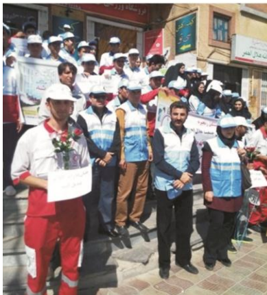
کمیته قلیان ها را گلدان کنیم با حضور کارکنان مرکز بهداشت شهرستان ایلام با جمعیت هلال احمر