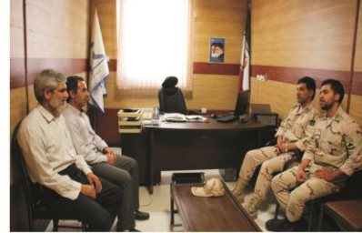
امضا تفاهتنامه همکاری بین دانشگاه و فرماندهی مرزبانی نیروی انتظامی استان در حوزه بهداشت و درمان