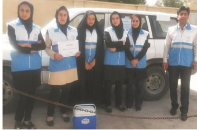
اجرای طرح ضربت بازرسی و کنترل مراکز تهیه و توزیع مواد غذایی در شهرستان ملکشاهی