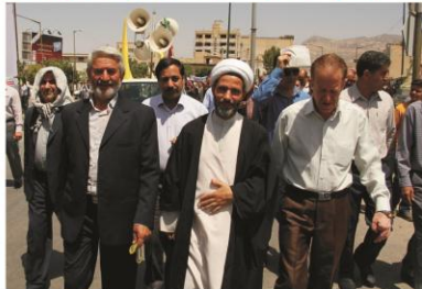
حضور کارکنان دانشگاه در راهپیمایی روز جهانی قدس